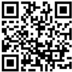
Abbildung 3 - Setup zigbee2mqtt https://lnk.codm.de/zigbee-90810-setup-z2m-de